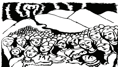
Jesus took the loaves, gave thanks, and distributed them

Może nie wrócę więcej, Może mi przyjdzie poledz tak samo, jak tyle, tyle tysięcy poległo polskich żołnierzy za wolność naszą i sprawę. Ja w Polskę, Mamo wierzę! I w świętość naszej sprawy! Dziś idę walczyć - Mamo kochana, nie płacz, nie trzeba, ciesz się, jak ja. Serce mam w piersi rozkołatanie, serce mi dziś tak cudnie gra. Za kraj! Za honor nasz! Dziś idę walczyć - Mamo!" J. Szczepański, podpor. AK, "Ziutek"